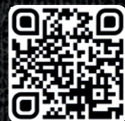
foto & design

Wir bieten Ihnen einen maßgeschneiderten Unternehmensauftritt: Fotografie, Webdesign, SEO-Optimierung, Filmproduktion, Mediendesign (Logo, Corporate Design, Konzept, Flyer, Anzeigen, Visitenkarten, Briefpapier, Autodesign) und vieles mehr.