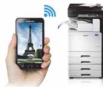
Einfaches Drucken von Mobilgeräten